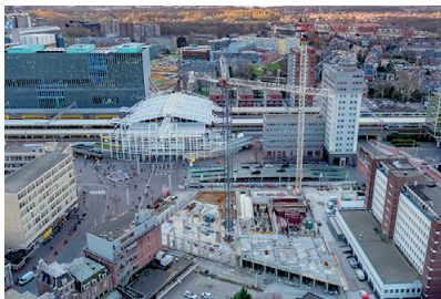
Stationsgebied in aanbouw