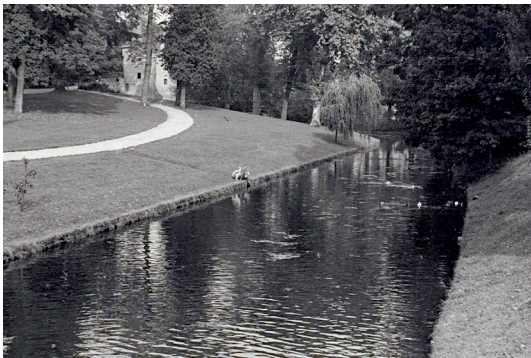
Westbuitensingel rond 1950