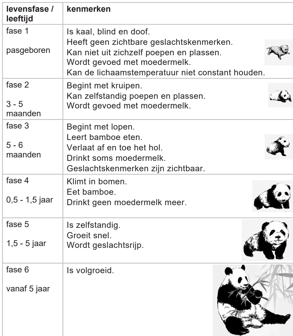
tabel 3 de levenscyclus van de panda

2p 4 Noteer twee kenmerken uit tabel 3 die horen bij het levenskenmerk stofwisseling.