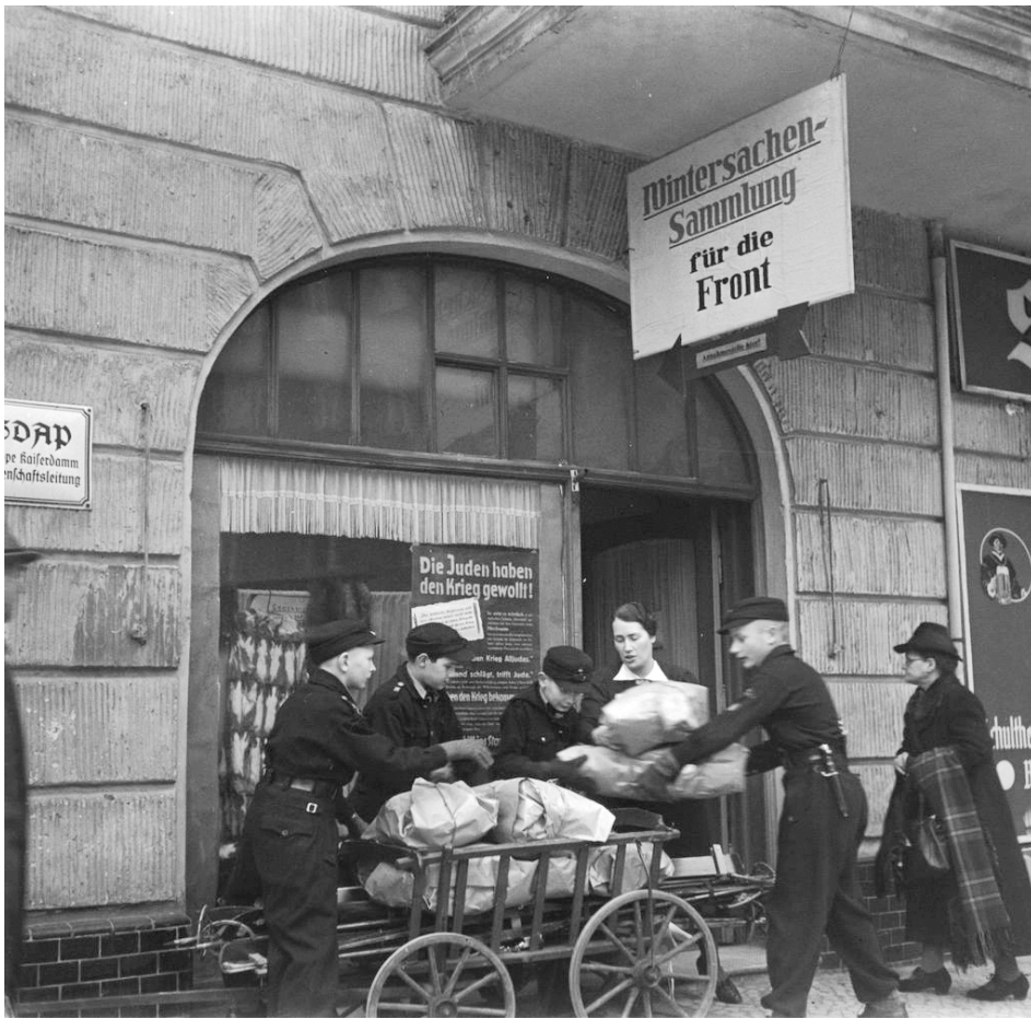
Foto van een kantoor van de vrouwenafdeling van de NSDAP in Berlijn in 1942: