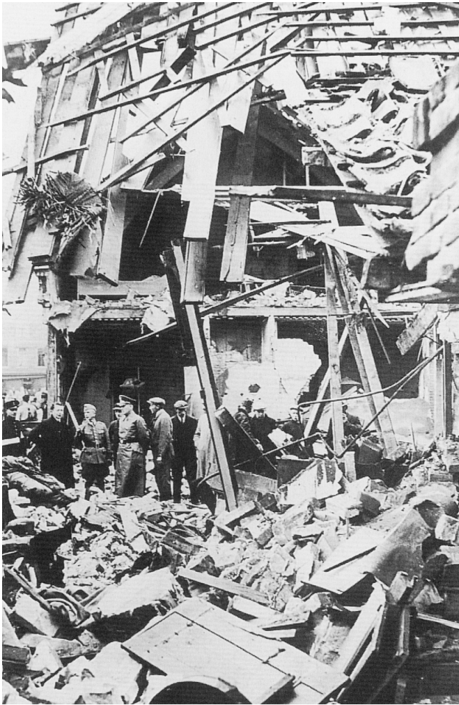
Foto van een huizenblok in Haarlem na een Engels bombardement in oktober 1940: