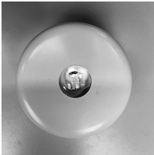
lampje bij licht