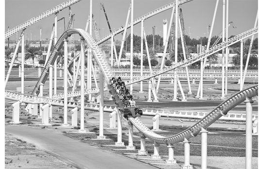
situatie 2: E_{bew} = 800 \text{ kJ}