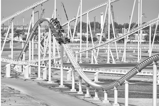
situatie 1: E_{bew} = 200 \text{ kJ}

Je ziet twee situaties van het treintje tijdens een rit met de bewegingsenergie op dat moment.